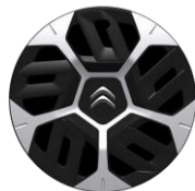
18-Zoll-Stahlfelgen mit Radzierkappen "Aerotech"