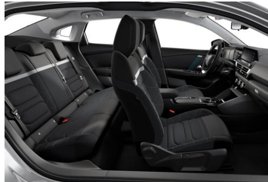
AMBIENTE URBAN GREY