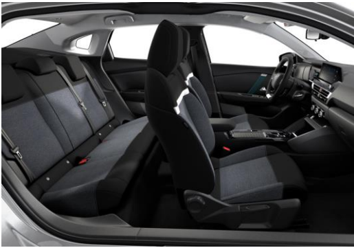
AMBIENTE "MEANWHILE" SCHWARZ, SERIE