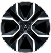
18-Zoll-Leichtmetallfelgen „CROSSLIGHT“ glanzgedreht