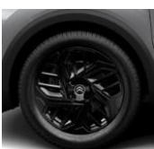
18-Zoll-Leichtmetallfelgen "Aeroblade" in Schwarz