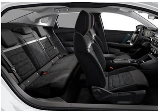
AMBIENTE ALCANTARA GREY