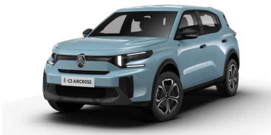
16-Zoll-Stahlfelgen mit Radzierkappen "Titanit"