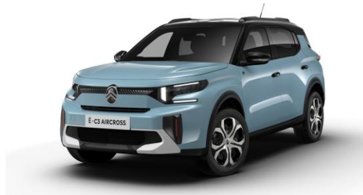
17-Zoll Stahlfelgen mit Radzierkappen Steel & Style