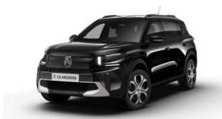
Perla Nera Schwarz (M)