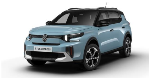
17-Zoll-Leichtmetallfelgen "Aragonit" mit Diamantschliff