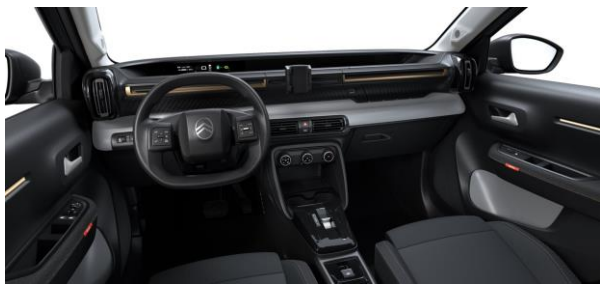
Ambiente YOU (Urban Bronze) Stoff Schwarz / Stoff Quadric