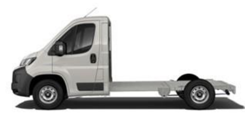
EXPEDITION GRAU P04K 350,00 (416,50)