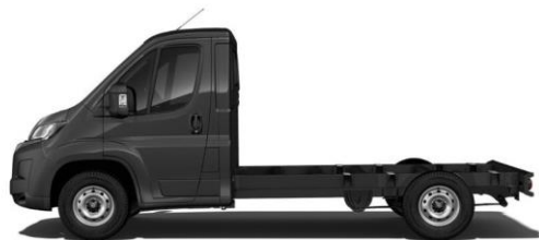
GRAPHIT GRAU M0E9 700,00 (833,00)