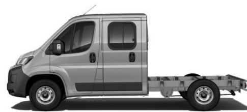
STAHL (ARTENSE) GRAU M0F4 700,00 (833,00)