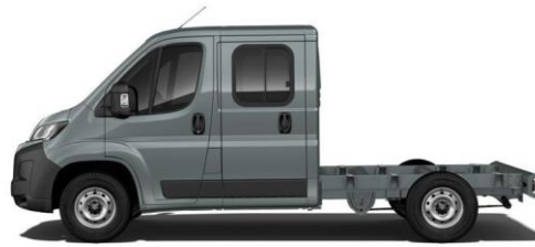
THUNDER GRAU P02B 350,00 (416,50)