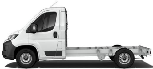
WEISS POPR 0,00 (0,00)