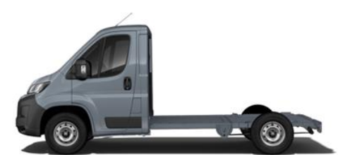
EISEN GRAU M0ZW 700,00 (833,00)